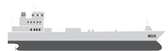
MARFRET NIOLON 1212 ML

Connexion Ferry mar Caraïbes vers Fort- de-France, Saint-Martin et Saint- Barthélemy.