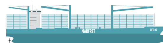
PORTE-CONTENEUR TYPE MARFRET GUYANE 2200 TEUS